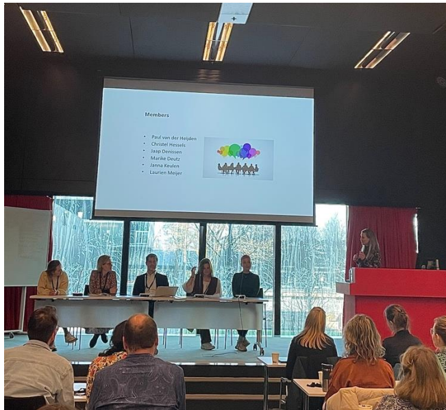
De dag werd afgesloten met een paneldiscussie.

objectieve interpretatie en werden er correlaties gevonden tussen onaangepaste persoonlijkheidskenmerken en stoornissen in het persoonlijkheidsfunctioneren.