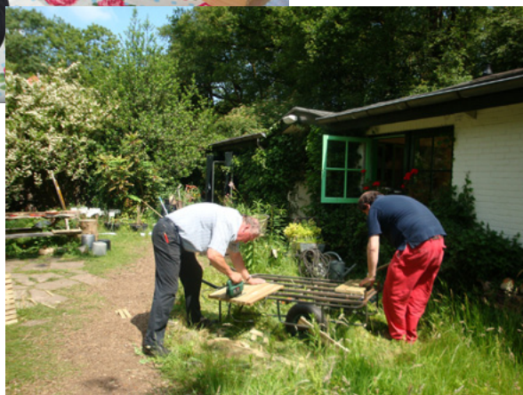
Opknappen tuinhuis Vlindertuin