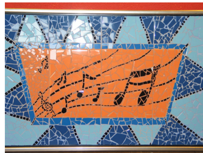
Mozaïeken met cliënten

http://www.ggzcentraal.nl/merken/zon-en-schild/vrijwilligerswerk/maatschappelijk-betrokken-ondernemen